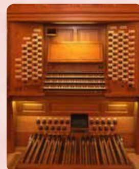
パイプオルガンの演奏台