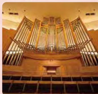
Kitaraのパイプオルガン

パイプオルガンは「楽器の女王」といわれ、オーケストラのような力強い音や、人の歌声のようなやわらかい音など、いろいろな音が出せます。教会やホールなどの建物と一体になっていて、世界でふたつと同じものはありません。Kitaraのパイプオルガンはフランス製で、4,976本(ヨ・ク・ナ・ル)ものパイプを持ち、日本で最も大きいオルガンの1つです。演奏台には4段の手鍵盤と足鍵盤、ステージ上の指揮者を見るための鏡、ストップと呼ばれる音色を変えるための装置や、音を記憶させるたくさんのスイッチが並んでいて、まるで飛行機の操縦席のようです。