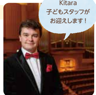
Kitara 子どもスタッフが お迎えます!

【料金】 全席指定(税込) 一般 1,000円 U18(5歳以上18歳以下) 500円 【KitaraClub会員料金】 一般 500円 [Lコード/12507] [Pコード/258-866]