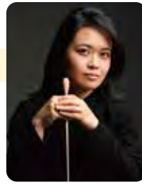
石崎 真弥奈 ©井村 重人

【料金】 全席指定(税込) S 3,500円 A 2,500円 U18(5歳以上18歳以下) 各席500円 【KitaraClub会員料金】 S 3,000円 A 2,000円 [Lコード/12495] [Pコード/258-819]