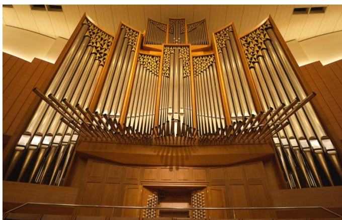
大ホールのオルガン (アルフレッド・ケルン社製)

Kitaraの専属オルガニストを講師として、ピアノ、エレクトーン等鍵盤楽器の経験者の方を対象に、パイプオルガン初心者向けのオルガン1日講座を開催します。