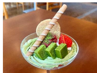
期間限定で味わえる「竹取パフェ」