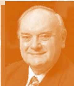
István Lantos イシュトヴァーン・ラントシュ (ピアノ)