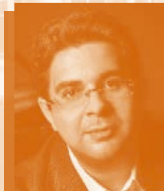
Gábor Farkas ガーボル・ファルカシュ (ピアノ)