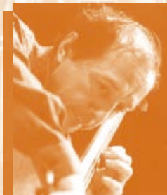
Miklós Perényi ミクローシュ・ペレーニ (チェロ)